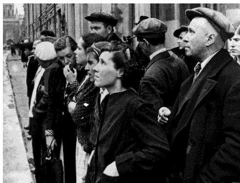
Жители столицы 22 июня 1941 года во время объявления по радио правительственного сообщения о вероломном нападении фашистской Германии на Советский Союз.

Родился 8 марта 1924 года в деревне Выворотково Бесединского района Курской области в семье крестьянина-середняка. После окончания Бесединской средней школы в 1940 году поступил на факультет языка и литературы КГПИ. Учёба прервалась в связи с началом Великой Отечественной войны .