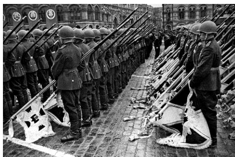
Парад Победы на Красной площади в Москве 24 июня 1945 года

Награждён орденами Отечественной войны I (21.02.1987) и II степени (26.05.1945), Красной Звезды (05.02.1945), медалями: «За победу над Германией в Великой Отечественной войне» (09.05.1945), «За отвагу» (28.11.1943), «За освобождение Варшавы» , «За взятие Берлина» и другими.