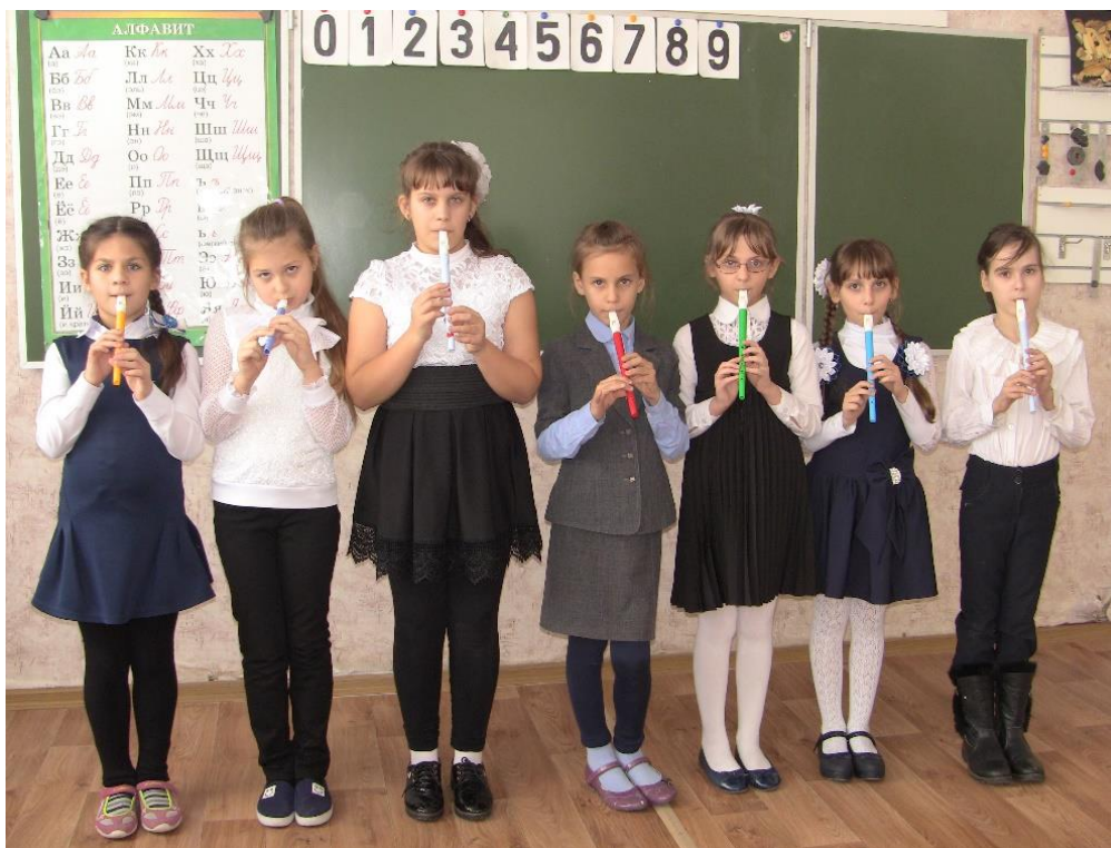
Ансамбль (септет) 3-4 классов МКОУ «СОШ №2 пос. им. К. Либкнехта» Курчатовского района Курской области