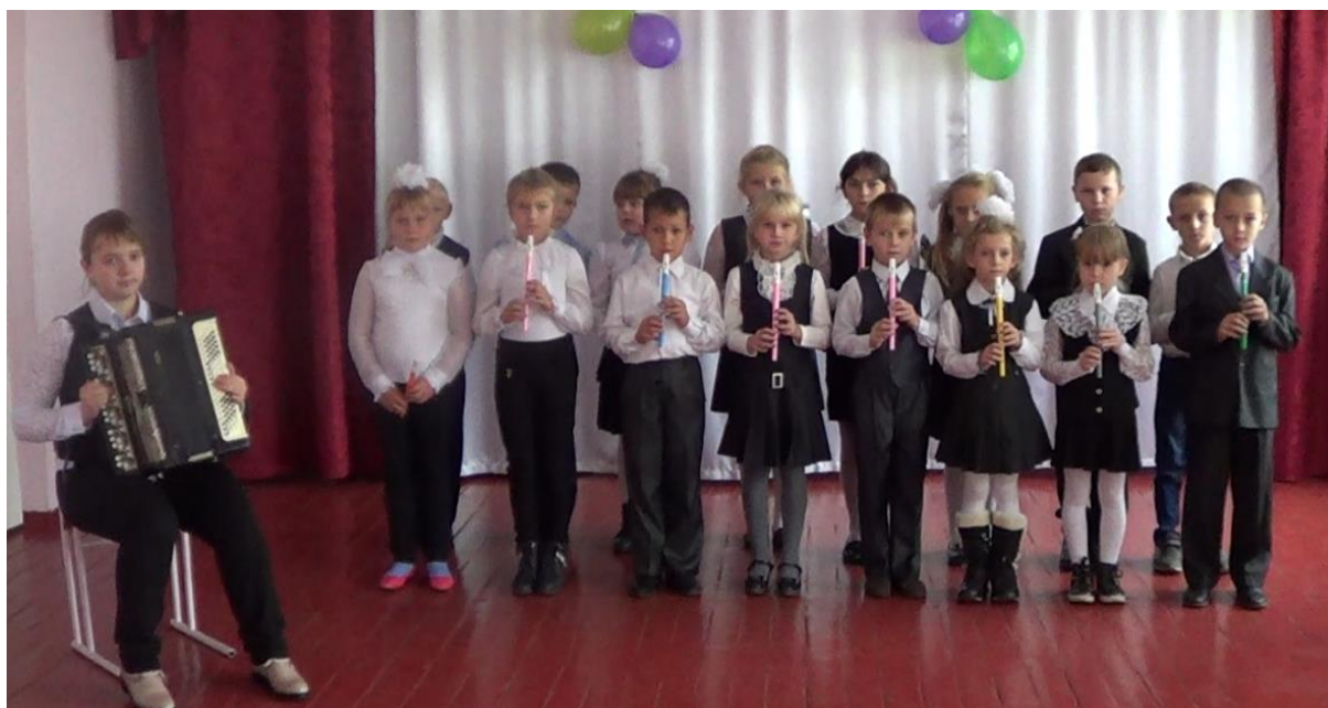
Ансамбль «Свирелька» МБОУ «Колонтаевская СОШ» Льговский район Курской области