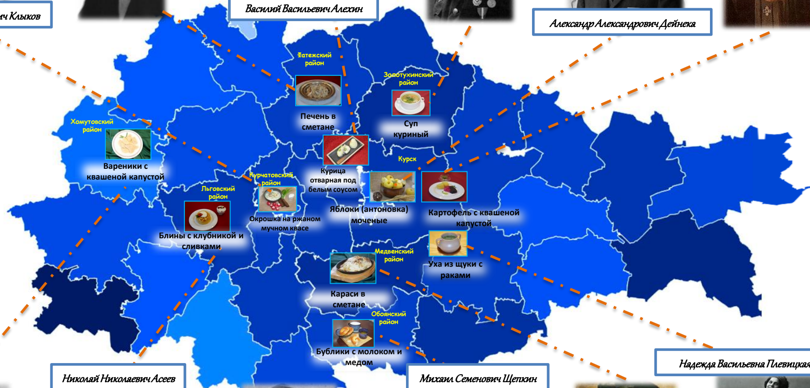
Николай Николаевич Асеев