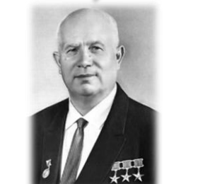
Никита Сергеевич Хрущев