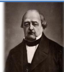
Константин Дмитриевич Воробьев