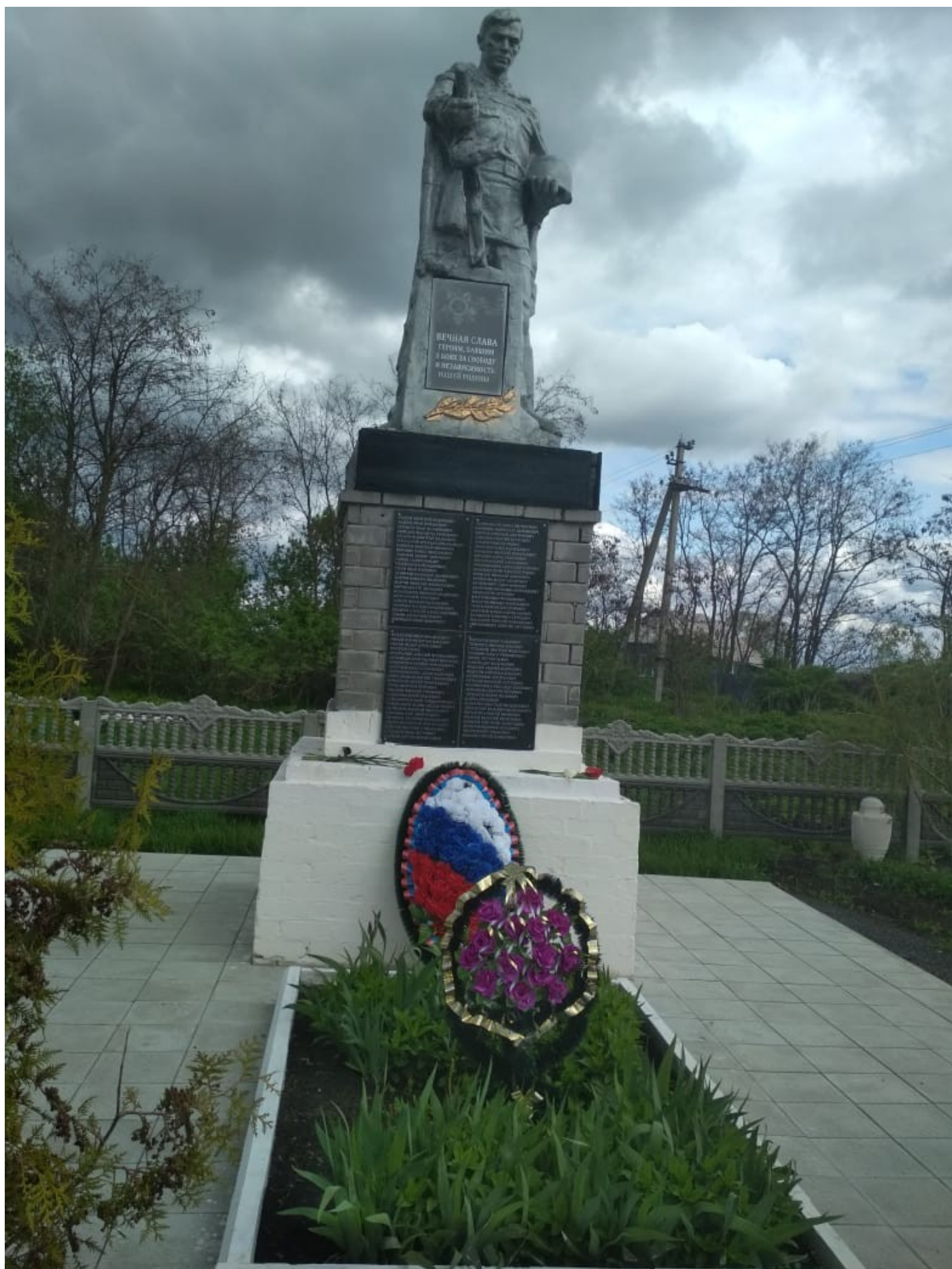
Вид памятника 2020 г.