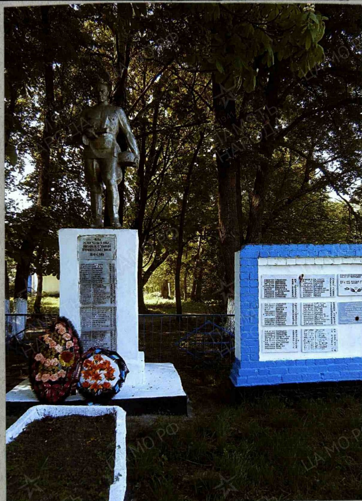
10. Дополнительная информация о захоронении: