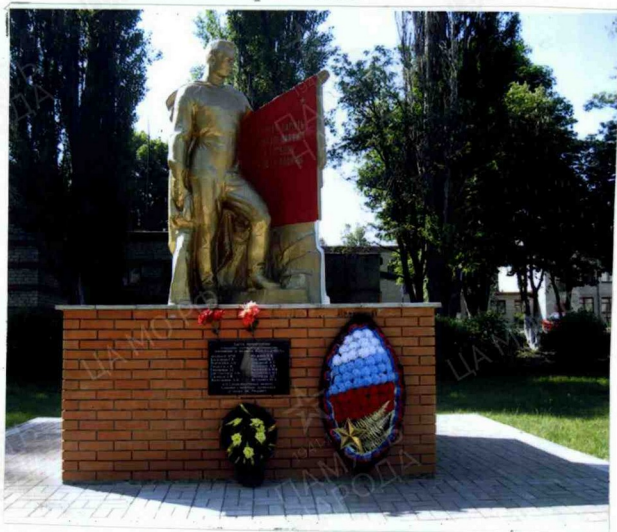
10. Дополнительная информация о захоронении.