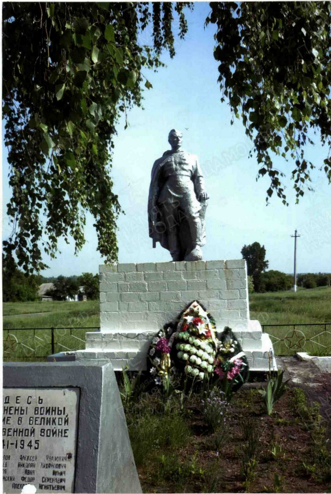
8. Фотоснимок захоронения