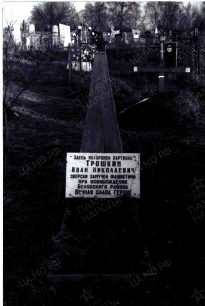
8. Фотоснимок захоронения