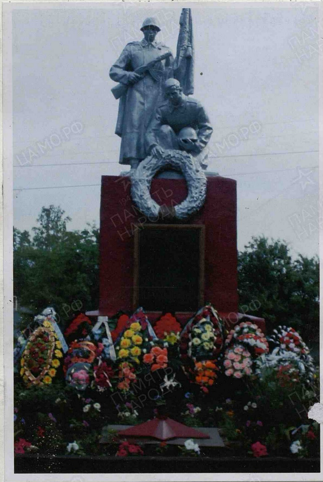
8. Фотоснимок захоронения