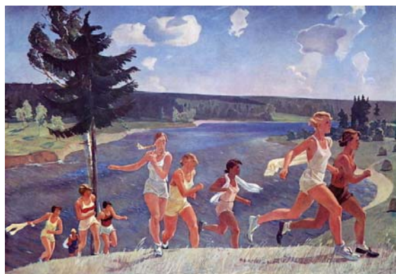
Рис.3, картина «Раздолье»

Следует заметить, что неспроста столь пристальное внимание А.А. Дейнека уделил именно Севастополю. Художник неоднократно посещал этот полюбившийся ему город. Именно там была в 1934 году написана картина «Севастополь. Вечер» [3]. Природа родной страны была одним из источников вдохновения для А.А. Дейнеки. Ее значимость и ценность будет выражена не в одной работе художника.