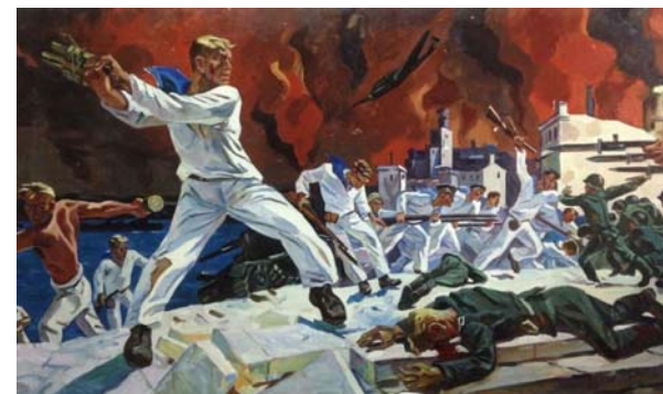
Рис. 2, картина «Оборона Севастополя»

В-третьих, творчество Александра Александровича Дейнеки, художника соцреализма, внесло весомый вклад в культуру Курского края. Таким образом, тема работы является актуальной. Написанная в 1952 году картина «Москва» демонстрирует образ послевоенной советской столицы. Смещение цветовой гаммы фона от дождливого темного неба слева к яркому солнечному справа может, по нашему мнению, обозначать переход из прошлого к будущему, которое художник видел светлым. Город представлен живым, развивающимся, находящимся в движении. Активно идет строительство, дымят трубы. Присутствие темы движения подчеркивает самолет, что также может символизировать и технический прогресс. Здесь проявляется характерная черта соцреализма — демонстрация устремленности в будущее. Несмотря на пережитые тяготы войны, советские граждане не утратили оптимизма и веры в завтрашний день.