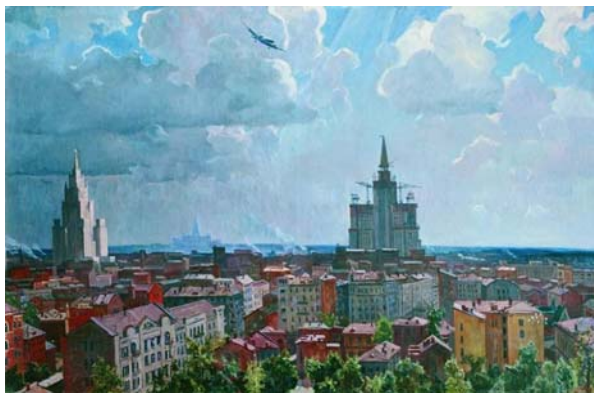
Рис. 1, картина «Москва»

Развитие отечественной культуры в целом и изобразительного искусства в частности тесно связано с историей России. Произошедшие в начале XX века революции изменили общество страны, поставили новые цели и задачи социальной модернизации. Возобладавшая коммунистическая идеология создала условия для появления нового направления в литературе и искусстве — социалистического реализма. Он, как указывает Евгений Добренко, выполнял социальные функции искусства и эстетические функции, был направлен на «производство социализма в СССР», а не только на его отображение [1, с. 17]. Изучение данного явления с позиции ценностей и смыслов, заключенных в соответствующих ему произведениях, актуально до сих пор. Во-первых, культура советского периода является предтечей и в то же время неотъемлемой частью современной российской культуры. Во-вторых, в творениях художников соцреализма отражено восприятие ими социального заказа того времени, окружающей их действительности и, что немаловажно, целей и устремлений общества и государства. В них выражены ценности и идеалы людей того времени.