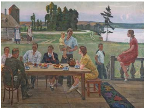
Рис. 4, картина «Вечер в колхозе (Чай на террасе)»

Стремительное развитие экономики в СССР, рост революционного движения и распространение социалистической идеологии в других странах требовали правдивого и исторически конкретного отражения на художественных полотнах и страницах книг. Действенным инструментом для этого были призваны стать произведения социалистического реализма.